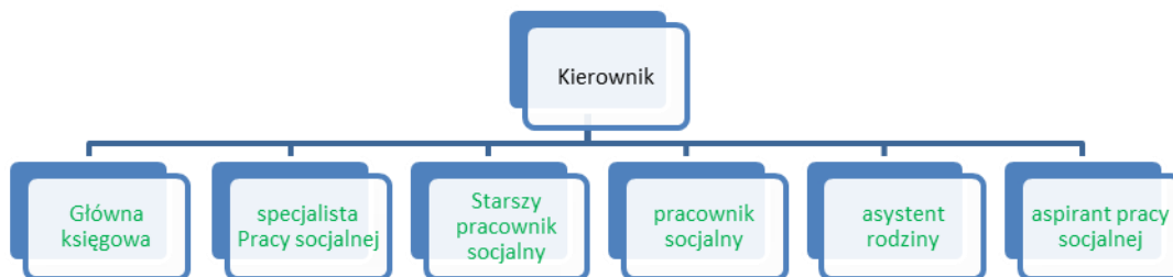
Schemat Nr 1. Struktura organizacyjna GOPS w roku 2020.

Strukturę organizacyjną w Gminnym Ośrodku Pomocy Społecznej w Siemiatyczach przedstawia poniższy schemat.