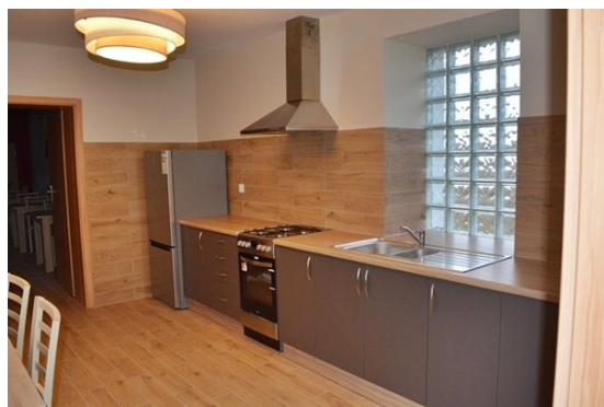
Klub w Rogawce: