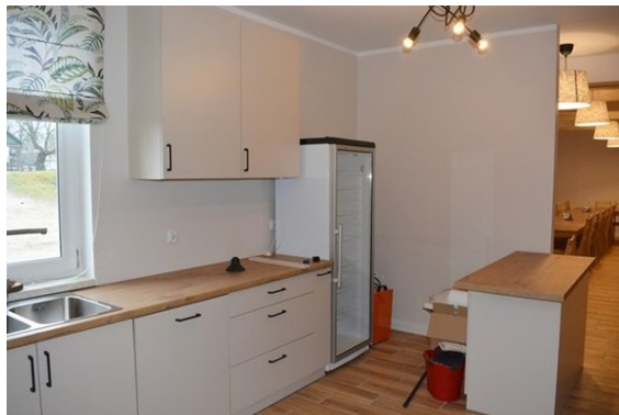
Klub w Boratyńcu Ruskim: